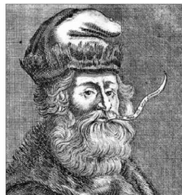
Ramon Llull. COL. ROTH-SCHOLTZII